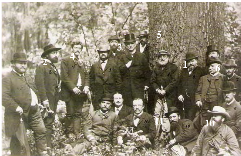
Excursión de la Sociedad de Antropología, Etnología y Prehistoria de Berlín, a Weisdin en los alrededores de Nev – Strelitz el 28.6.1885

Se estableció de nuevo en Alemania, pero en esta oportunidad en Berlín, donde radicó hasta 1871, el objetivo era: culminar otros estudios e iniciar su labor como curador y conservador de colecciones. En 1866, hace el doctorado en Geografía e Historia en la Universidad de Berlín, institución que lo acogió como profesor titular. Dos años más tarde es designado Director Asistente, para la colección etnológica y prehistórica de los museos de la realeza berlinesa. De esta forma se ratificó como una personalidad en la especialidad y por el prestigio alcanzado fundó en